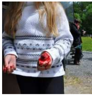
Reiter mit verletztem/amputierten Daumen