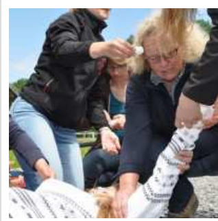
Die Hand der Reiterin mit starker Blutung sollte möglichst hoch gehalten werden