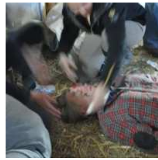
Welche Verletzung weißt der Reiter auf?