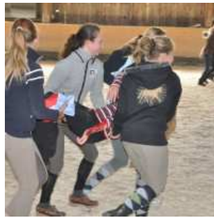
Evakuierung der Reiter aus der Reithalle