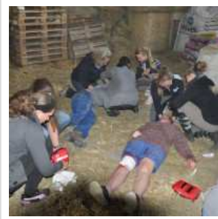
Erste Hilfe auf dem Reiterhof