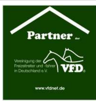
Pflasterkoffer ist offizieller Partner vom VFD

Ein weiteres Szenario war eine junge Reiterin, die sich einen Daumen amputiert hatte. Was tun? Wüssten Sie es?