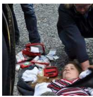
Die richtige Erste Hilfe Ausrüstung kann Reitern das Leben retten