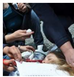
Alles helfen mit das richtige Verbandsmaterial anzugeben