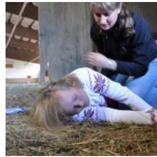
Stabile Seitenlage ist bei bewußtlosen Reitern absolut nötig