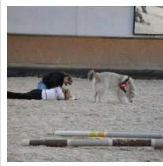
Weitere Reiterinnen brechen vor Schock zusammen

Panische verletzte Reiterin macht den Helfern Schwierigkeiten