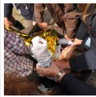
Der verletzte Reiter darf nicht weiteren Wärmeverlust erleiden