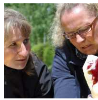
Unverletzte Reiter helfen der Verletzten.