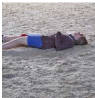
Verletzte Reiterin liegt bewusstlos in Reithalle