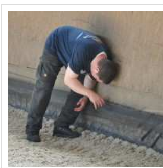
Reiter lehnt verletzt an Reithalle

Mehrer Szenarien wurden eingespielt, wie z.B. vier keuchende verletzte Reiter in einer Reithalle. Da mussten die unverletzten Reiter ganz schön ran und den Reiterhof evakuieren , deutete doch alles daraufhin, dass die Verletzten unter Rauchvergiftungen litten.