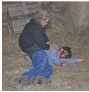
Erste Reiter in Sicherheit im Vorraum der Reithalle