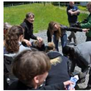
Koordination beim Reitunfall